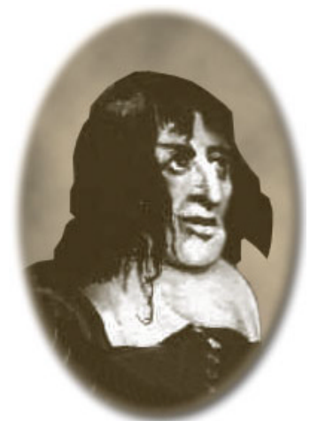
Robert Hooke (1635-1703)

Participó en la creación de la primera sociedad científica de la historia, la Royal Society de Londres. Sus polémicas con Newton acerca de la paternidad de la ley de la gravitación universal han pasado a formar parte de la historia de la ciencia.